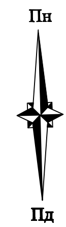
ПРОЕКТНИЙ ПЛАН, СХЕМА ПЛАНУВАЛЬНИХ ОБМЕЖЕНЬ, СХЕМА ОРГАНІЗАЦІЇ РУХУ ТРАНСПОРТУ ТА ПІШОХОДІВ М 1:1000